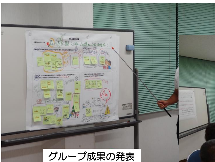
グループ成果の発表